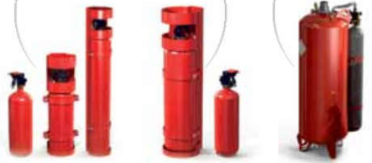
Модуль порошкового пожаротушения МПП ГАРАНТ-100