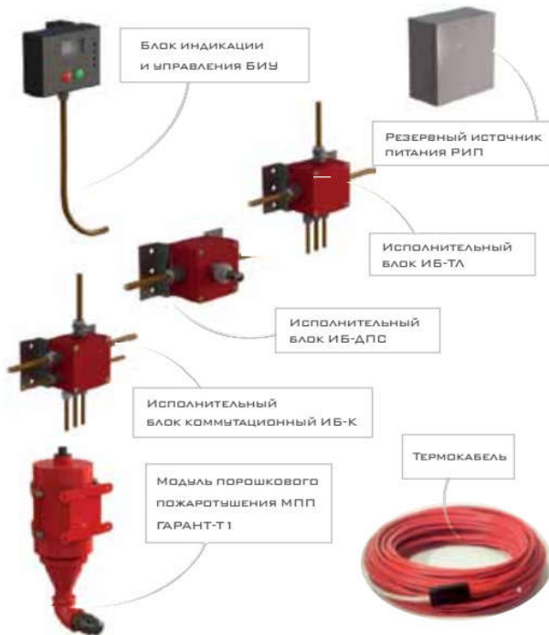
Установка газового пожаротушения модульного типа УГПМ