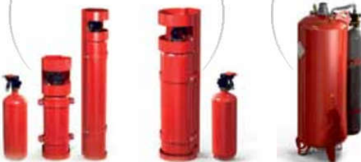
Модуль порошкового пожаротушения МПП ГАРАНТ-100