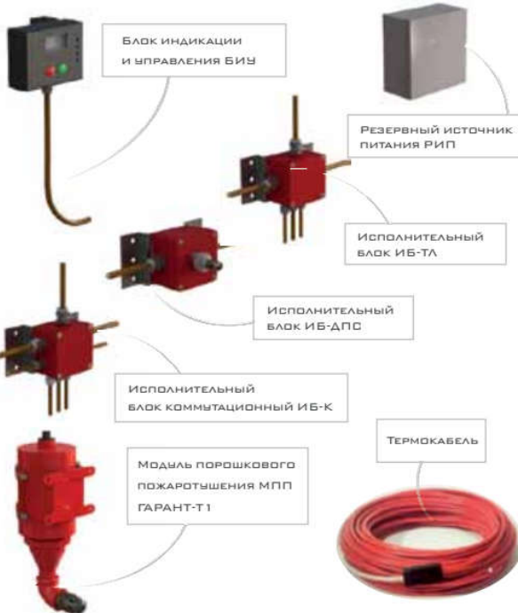
Установка газового пожаротушения модульного типа УГПМ